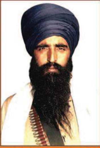
ਮਰਨਾ ਸ਼ਾਨ ਨਾਲ