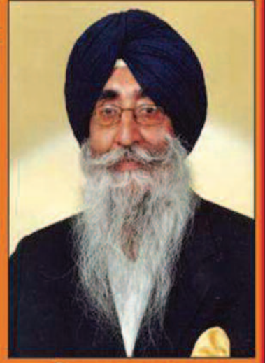
ਜੀਟਾ ਅਣਖ ਨਾਲ